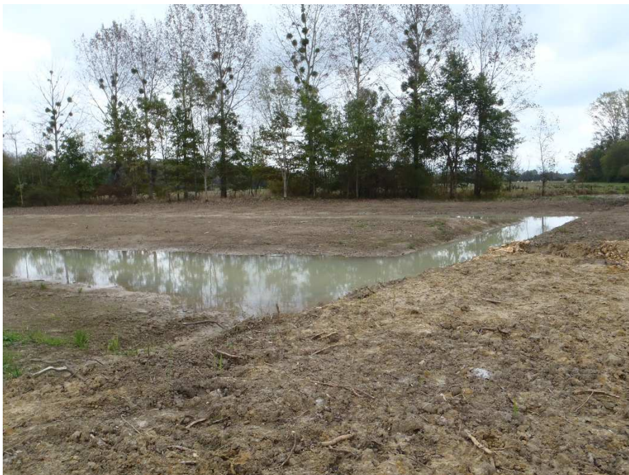
Photographie 6 : zone humide de la Culée après travaux : bassin aval et chenal de connexion entre les deux bassins