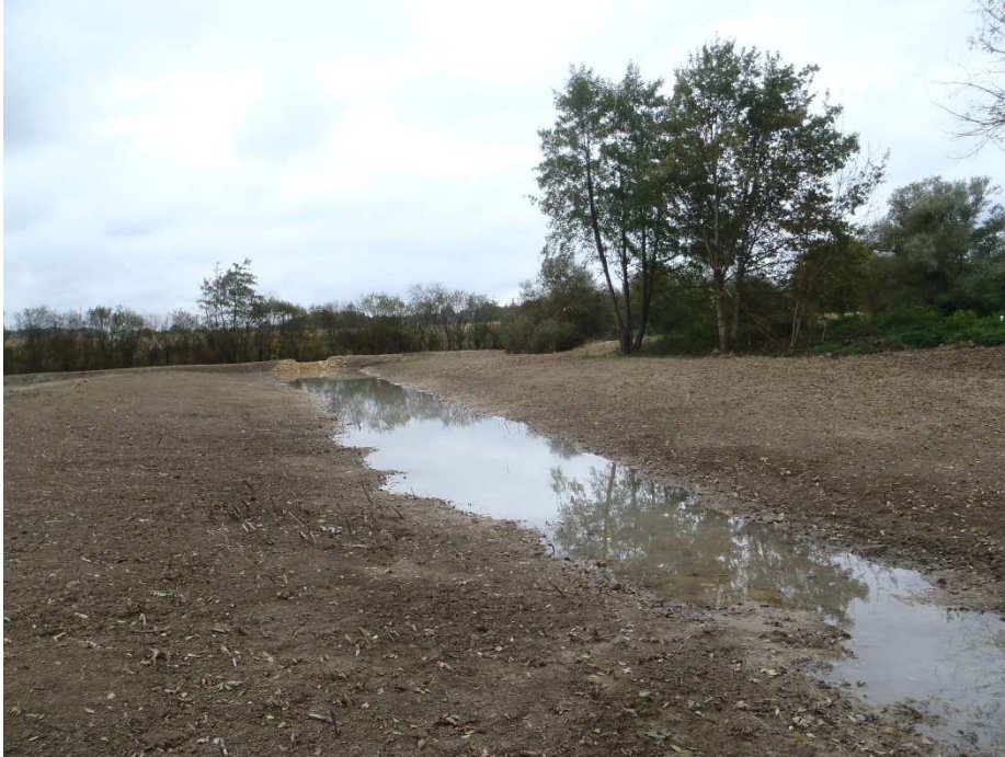
Photographie 3 : zone humide de la Culée après travaux : bassin aval et point de connexion en arrière-plan