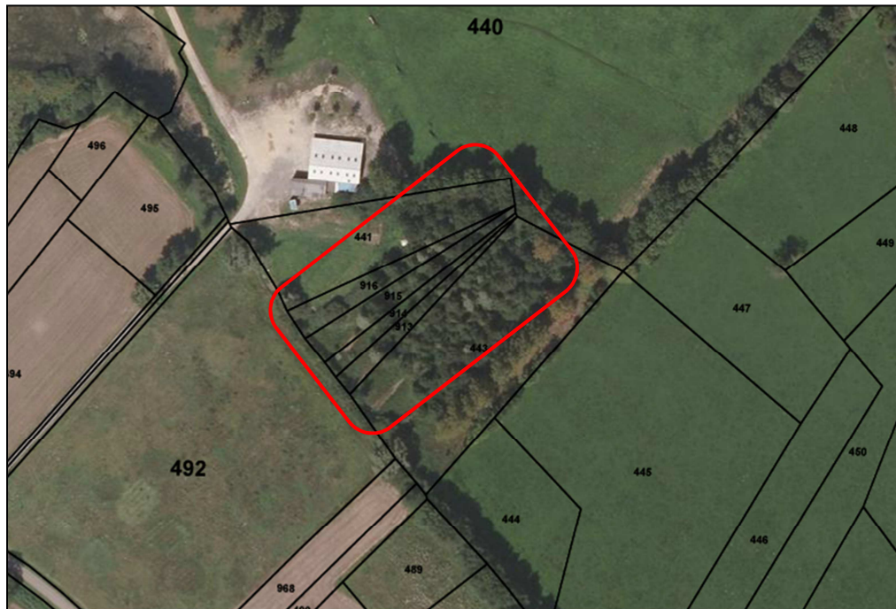
Carte 2 : Emplacement de la frayère de la Culée à Sainte-Croix