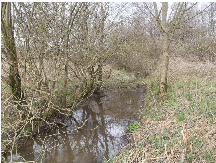
Photographies 1 et 2 : zone humide de la Culée avant travaux