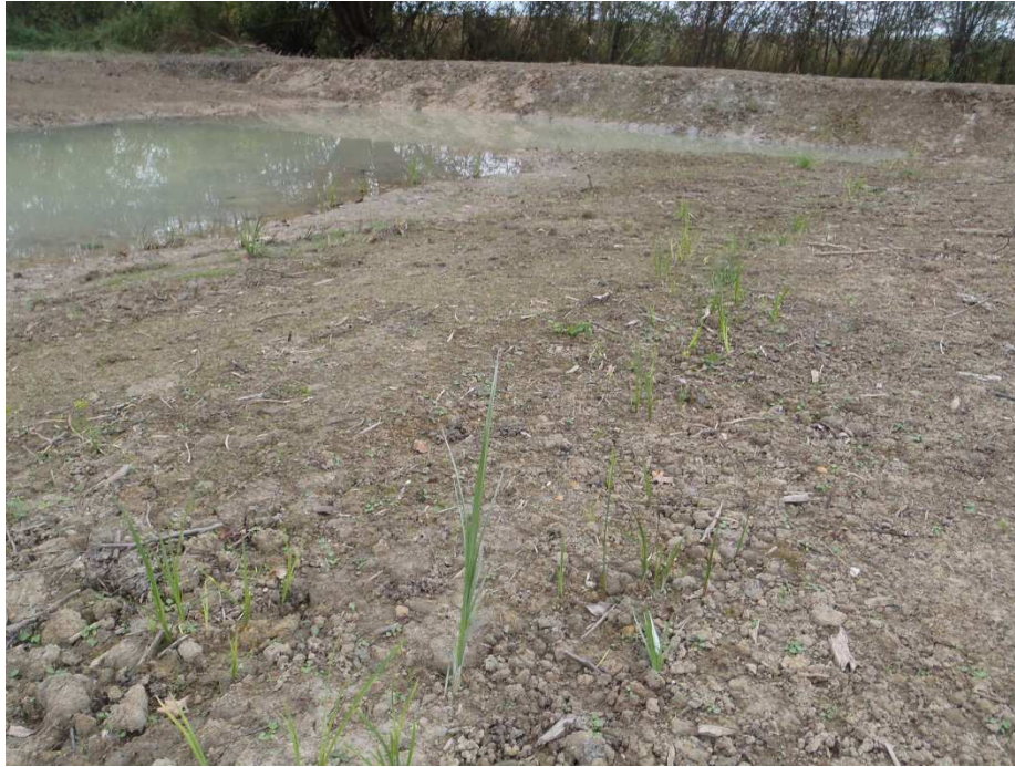
Photographie 5 : zone humide de la Culée 1 mois après travaux : la végétation herbacée commence à reprendre ( Phalaris arundinacea et Carex sp. )