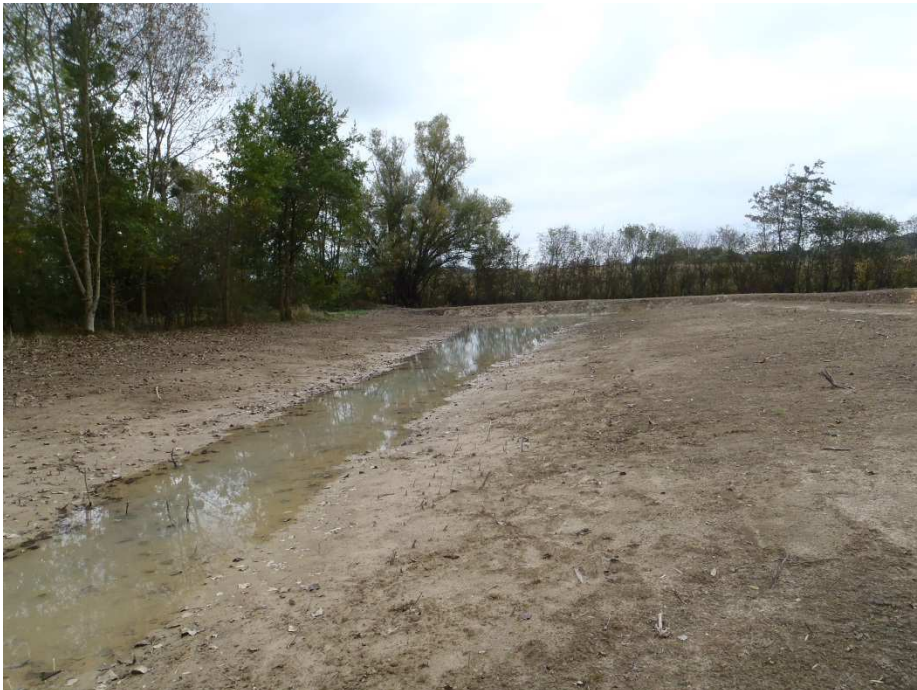
Photographie 4 : zone humide de la Culée après travaux : bassin amont