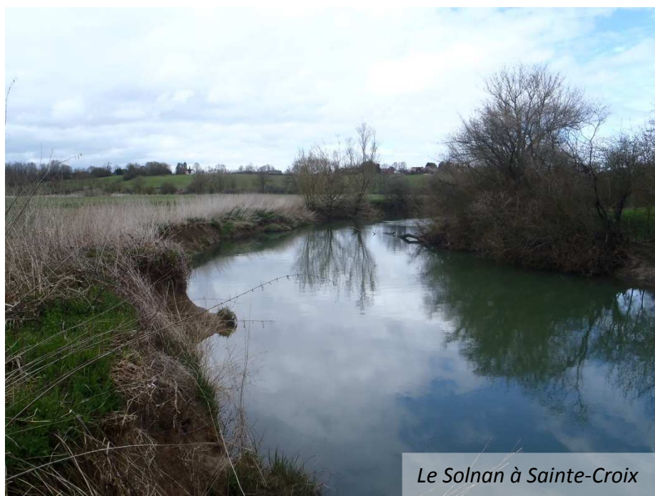
Le Solnan à Sainte-Croix